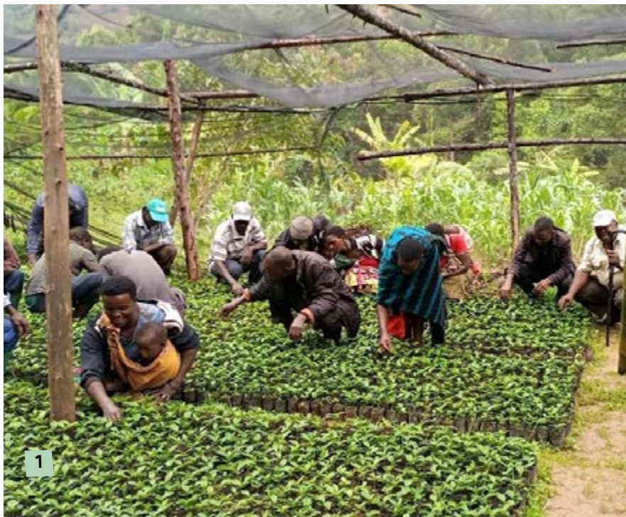
1 Kaffeprojektet gick in på sitt tredje år 2023. 2, 3 och 4 Tusentals agroforestrybönder samlades på årets symposium.

Panapostawi Miti – Watu Hustawi = Där träd och människor växer