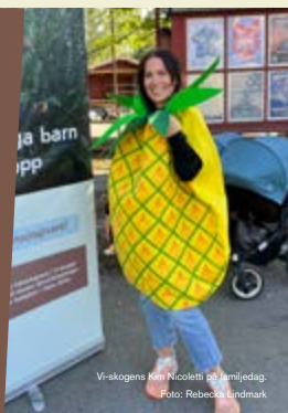
Vi-skogens foto Nicoletti på familjedag.

Även i år medverkade Vi-skogen på KfS roliga familjedag på Skansen. Vi erbjöd ansiktsmålning, ett quiz om träd som Vi-skogen planterar och chansen att fotografera sig i fruktdräkter. Vårt bord blev väldigt uppskattat och välbesökt av barn och vuxna i alla åldrar.