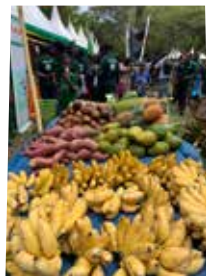
Biologisk mångfald på agendan på årets Agroforestry Symposium.

Vi-skogen är glada över att stått värd för ytterligare ett lyckat Agroforestry Symposium i Tanzania – det sjunde i ordningen! Årets tema var "Biologisk mångfald för förbättrad livsmedelssäkerhet och försörjning" och fokus var hur agroforestry-metoder ökar bönders inkomster och mildrar klimatförändringarnas effekter. På Agroforestry Training Center i Musoma delade småskaliga bönder och studenter erfarenheter med representanter från civilsamhället, lokala och nationella myndigheter, privatsektorn, internationella organisationer och givare. Alla enades om att ett ökat samarbete mellan regeringen och övriga aktörer är nödvändigt för att få till stånd en hållbar förändring.